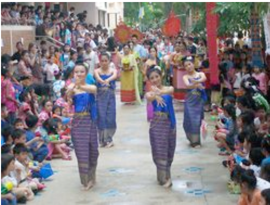
Parade traditionnelle – Thaïlande