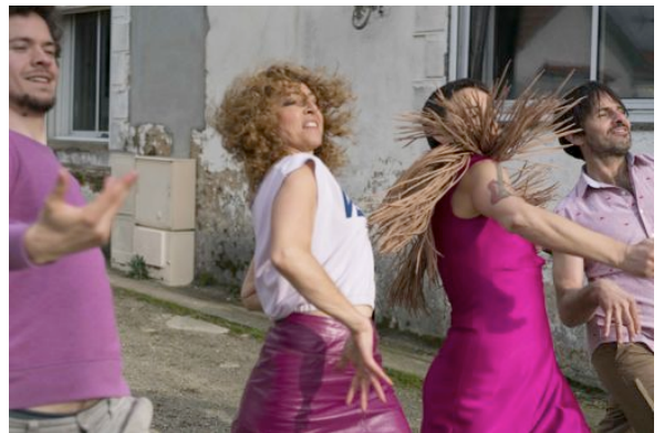
Groupe Berthe – Déhanchés